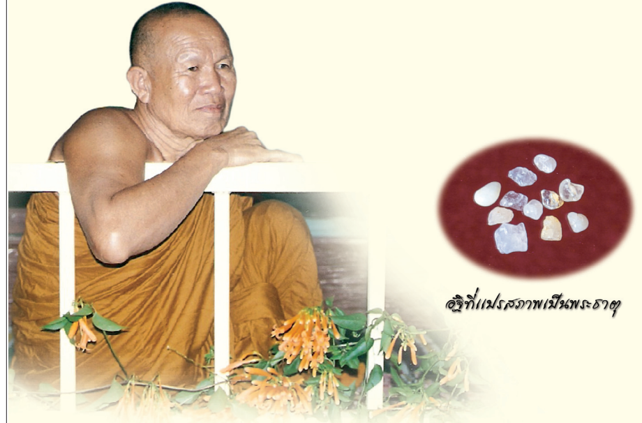
อัฐิที่แปรสภาพเป็นเพชรธาตุ

๓๓/๒๘ ซอยเพชรบุรี ๕ ถนนเพชรบุรี เขตราชเทวี กรุงเทพฯ ๑๐๔๐๐ โทรศัพท์ ๐๒-๒๑๕-๙๖๘๑, ๐๘๐-๒๐๑-๒๒๗๗, ๐๘๑-๔๐๘-๑๕๗๘ โทรสาร ๐๒-๒๑๖-๙๔๖๕ email: horatanachai@gmail.com